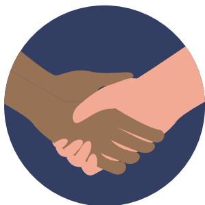
Aperto de Mãos

A doença pode ser transmitida, de pessoa para pessoa por meio de gotículas do nariz ou da boca que se espalham quando uma pessoa com COVID-19 tosse, espirra ou fala. As gotículas também podem pousar em objetos e superfícies ao redor como: mesas, computadores, telefones, maçanetas, corrimãos e celulares.